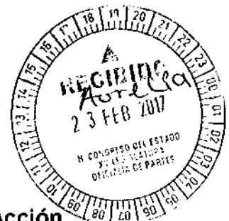
DIP. MAYULI LATIFA MARTÍNEZ SIMÓN.

Coordinadora del Grupo Parlamentario del Partido Acción Nacional y Presidenta de la Comisión de Anticorrupción, Participación Ciudadana y Órganos Autónomos de la H. XV Legislatura del Estado de Quintana Roo.